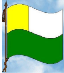
Imagen 2. Bandera Institución Educativa NARCISO CABAL SALCEDO

EL VERDE: Significa los valores de bondad y justicia, representa la fuerza, la esperanza, la energía, el vigor y el color de la naturaleza que rodea nuestra Institución Educativa NARCISO CABAL SALCEDO.