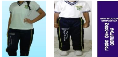
Imagen 3. Uniforme Institución Educativa NARCISO CABAL SALCEDO